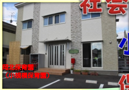
岡北保育園 (小規模保育園)